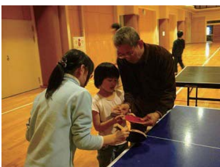
ラケットの持ち方を教えてもらうわっちゃん