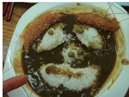
子どもたちのデザインしたカレー、かわいい!