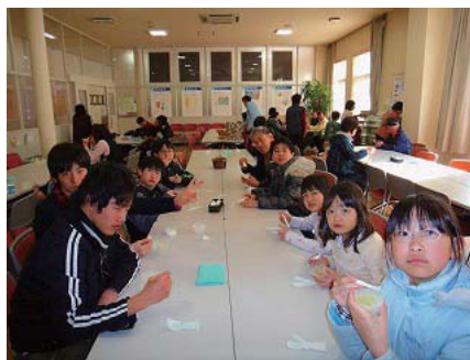
かんてんぱへでゼリーを試食中!