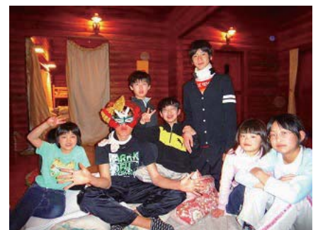
終わりの会は仮装も楽しめます!