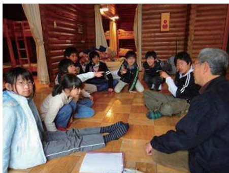
オリエンテーションは輪になって

8:39 アルペン伊那号が出発。途中、養老SAで昼食のお買い物ゲーム。小学生500円、高校生600円の予算。時間が5分し