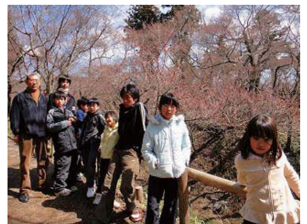
桜開花直前の高遠城跡公園にて

いかがでしたでしょうか。子どもたちの感想を聞くと、雪や星空、美しい山並みなど、信州のすばらしい自然が、子どもたちの心をなごませているように感じました。小学生、中学生の時期に雄大な自然の中に身を置くことの大切さを、改めて感じたのです。豊かな自然環境の中で、自分を見つめ直し、それがやさしさや細やかさにつながるようにも思います。これからも、子どもたちのやわらかな心がじわっと広がっていくような体験を企画していきたいと思えます。