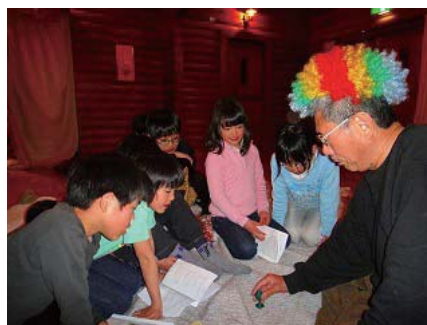
すぎさんのマジックショーは大人気!