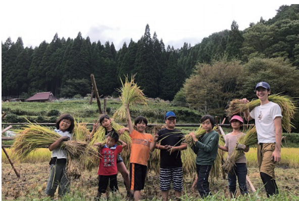
昨年の稲刈りの様子。豊作のため、刈っても刈っても終わらない!

学校現場では、成果が目に見える「田植え」と「稲刈り」の部分だけを切り取って、「米作り」活動を行うところが多いです。雑草処理は農薬に任せたり、先生が陰で行う作業となってしまう。「米作り」にとって何が大切なのかというのを、今回の体験を通して本当の意味で感じたのではないのでしょうか。