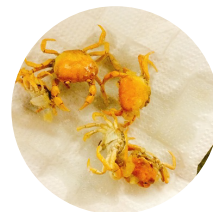
子どもたちの採った サワガニの天ぷら