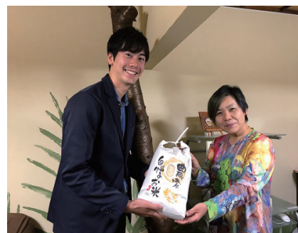
昨年も「此花こども食堂」に収穫した新米15kgをお届けしました。此花こども食堂は、区内の小中学生が誰でも安心して立ち寄れる居場所として、毎月第三金曜日の夕方に、子どもたちに晩御飯を提供しています。