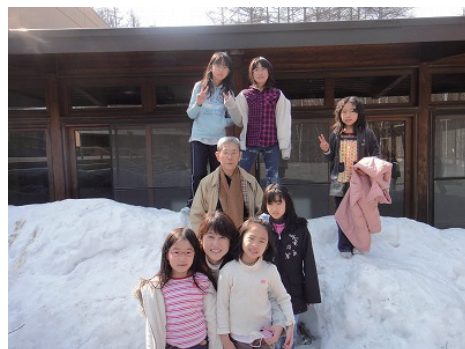
すっかり仲良くなった女の子チーム+すぎさん

ます。材料は、小麦粉、砂糖、塩、卵、イースト、お湯。製造工程は、ミキサーで3分生地をこねる→バターを入れてさらに3分こねる→高速で10分こねる→20分生地をねかす→生地を分割(一つ約50グラム)→10分ねかす→成形(つつむ、のばす)→発酵室に約30分入れる→200℃の窯で10~15分焼く→出来上がり、という流れです。一番難しかったのは、チョココルネの生地を巻きつけるところでした。