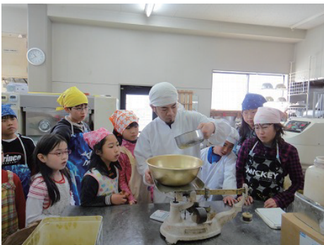
パン職人の真剣な眼差しに刺激される子どもたち

15:30 子どもたちの大好きな、伊那食品のかてんパパのお店へ。杏仁豆腐、ぶどうとオレンジのゼリーを試食しました。