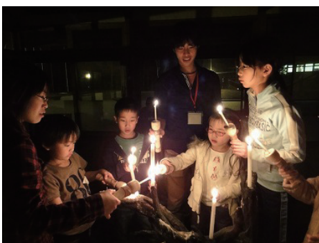
蜀台のろうそくに、みんなで火をつけて