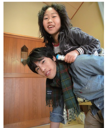
肩車大好きのももはちゃん