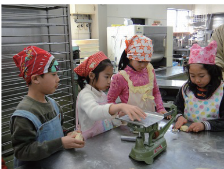
約50グラムにハカリで測ります

16:20 大阪行き的高速バスが発車。バスの中では、別れを惜しむように、盛り上がっています。「渋滞してくれたら、もっとみんなと遊べるのに」と女子チーム。ほんとに楽しいですね。