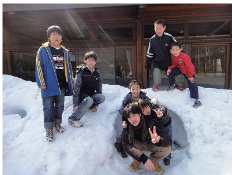
雪の中で、元気いっぱいの子チーム

し.30 起床。 7:00 朝のつどい。その後は、みんなで協力してお部屋の掃除。 8:00 朝食。 9:15 自然の家の職員の方々にお礼を言ってから出発。今日も快晴です。 10:30 原口製パンに到着。エプロンと三角巾をつけ、しっかり手を洗ってから、パン作りの開始です。今回は、ホットドック、カレーパン、チョコパンの3種類を作り