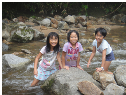
森林浴組は川遊びもしました!

20:00 終わりの会。この二日間で楽しかったことを聞いてみると、「シャワークライムでの飛び込み」「朝食のメロンパン」「地元の人との郷土