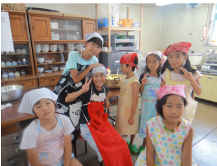
エプロン姿でかわいい女の子たち