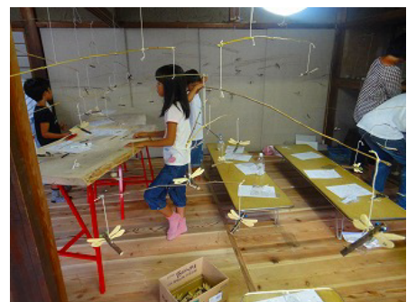
トンボのモビール、ダイナミックな大きさです

21:03 梅田に到着。チェアやモビール など、おみやげをいっぱい持って解散。また 会おうね!