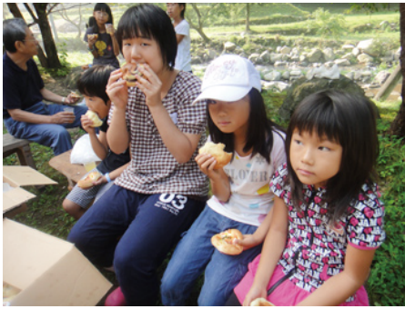
焼きたてパンは、フワフワです

「桃太郎みたいやな。おばあさんは川で洗濯・・・やろ」と言っていました。確かに！ 体験場所は、昭和30年代の景観を残す板井原集落にある、築90年の古民家の庭先です。