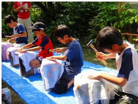
レイアウトが決まれば、金づちでたたきます