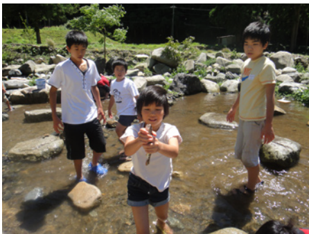
「よっしゃ!魚つかまえた!」とわっちゃん

9:10 お母さんたちに見送られて、梅田を出発です!バスの中では、すぐに打ち解けて、話を始めます。子どもってすごいな、といつも思います。