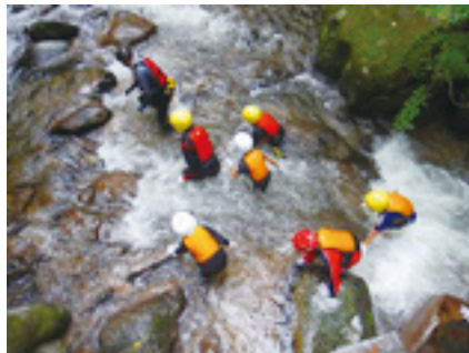
結構激しい流れの中を登っていきます

12:00 みたき園にて昼食。みたき園は、茅葺き屋根の古民家のある、自然がいっぱい感じられる素敵なおところです。ここで、朝採ってきた山菜の天ぷら、トマトのまるかじり、手作りこんにやくなどのお弁当を作っていただきました。おかみさんが、食べる前に子どもたちに話をしてくれました。事前訪問の際、「山菜の天ぷらは子どもたちが好きではないかも・・・」と相談すると、「採ったばかりの山菜の天ぷらは、食べたことが