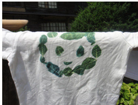
こんなかわいいTシャツが出来上がりました!