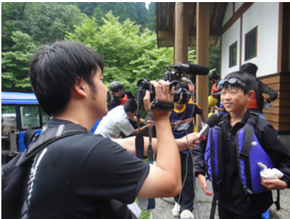
日本海テレビの取材が入りました!

でね!」というとすぐに並んでくれるのに、大阪や東京の子どもたちは、なかなかすぐには動いてくれません。これには、日頃の先生と生徒の関係が現われていると思います。「大人の言うことをしっかり聞く」という姿勢が出来ていないことは、とても気になります。全国的にそうになっているのかと想像していたら、きっちり出来ているところもあるのですね。いろいろ考えさせられます。