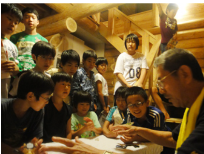
すぎさんのマジックに興味津々

料理」「椅子作り、でも金づちが難しかった」「ビッグなカエルを見つけた!」「魚つかみ、でも逃げられた」「森林浴」などがあげられました。その後は、ビンゴ大会とすぎさんのマジックショーで、盛りあがりしました。