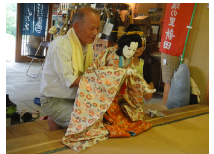
人形浄瑠璃は迫力がありました