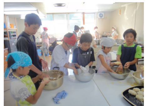
男の子たちの料理、なかなかいいですね!

13:30 智頭町は森林セラピー基地として、大人向けのセラピーツアーなど、様々なチャレンジをしています。セラピーの前後にストレスチェックをしているとお聞きし、私たちも試してみることにしました。唾液アミラーゼを測定することで、ストレスの値を測定します。「今まで子どもさんの数値を測定したことがありますが、子どもはストレスがほとんどないですよ!」と聞いていたのに、今回参加の子どもたちの中には、大人以上にストレスの高い子も。測定しようとする「オレ、絶対ストレス高い!」と宣言する子も。今回のスクールで、数値が下がるといいですね!